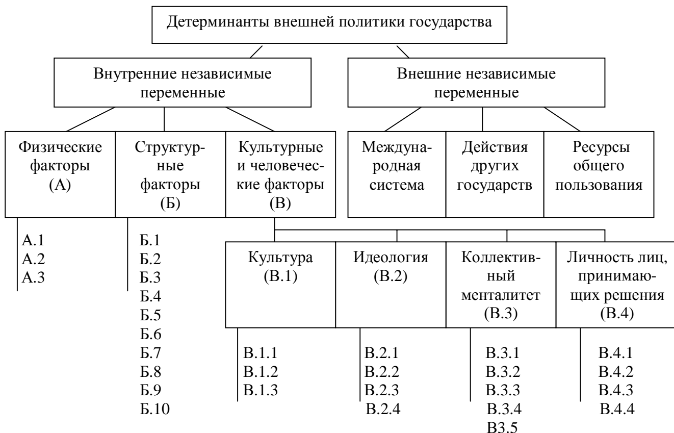
Рис. 2. Концепция статического измерения системного анализа Ф. Брайара и М.Р. Джалили (по П.А. Цыганкову, 2003)

Приведенные группы факторов включают следующие показатели. Физические факторы (А): А.1 географическое положение, А.2 природные ресурсы, А.3 демографическая ситуация. Структурные факторы (Б): Б.1 политические институты, Б.2 экономические институты, Б.3 технологический, экономический и человеческий потенциал государства (его способность к использованию физической и социальной среды), Б.4 политические партии, Б.5 группы давления, Б.6 этнические группы, Б.7 конфессиональные группы, Б.8 языковые группы, Б.9 социальная мобильность, Б.10 территориальная структура государства (доля городского и сельского населения), Б.11 уровень национального согласия общества. Культурные и человеческие факторы (В). Культура (В.1): В.1.1 система ценностей, В.1.2 язык, В.1.3 религия. Идеология (В.2): В.2.1 самооценка властью своей роли, В.2.2 самовосприятие администрации государства, В.2.3 особенности восприятия мира администрацией государства. В.2.4 основные средства давления, применяемые властью. Коллективный менталитет (В.3): В.3.1 историческая память народа, В.3.2 образ «другого» в сознании народа, В.3.3 линия поведения администрации государства в области международных обязательств, В.3.4 чувствительность общества и государства к проблеме национальной безопасности, В.3.5 мессианские традиции. Качества лиц, принимающих решения в государстве (ЛПР) В.4: В.4.1 восприятие ЛПР своего окружения,